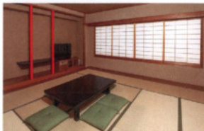
和室 Japanese Style Room (全9室/10畳7部屋・12.5畳2部屋)