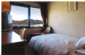
シングルルーム Single Room (全94室/14~16㎡)