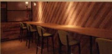
wifi・コンセント完備のカウンタースペース Counter Space

Please enjoy a pleasant time in the space where the warmth of wood and the scent of coffee.