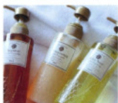
アメニティ Bath Amenity