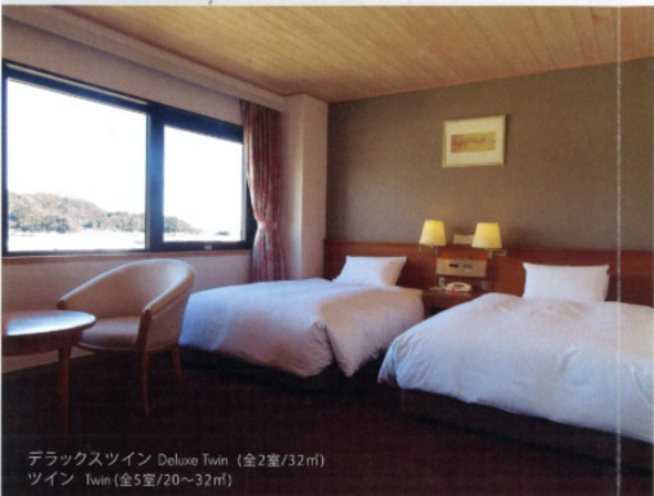
デラックスツイン Deluxe Twin (全2室/32㎡) ツイン Twin (全5室/20~32㎡)

快適さを追求した116室。佐伯の自然溢れる景色とともに心も体も安らげるひとときを、こゆっくりとお過ごしください。