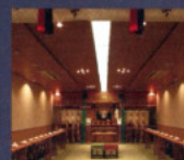
神設 翔翔殿 Shyoshyouden Shrine