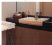
洗面台 Wash Stand