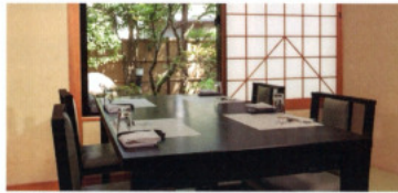
個室完備 2名~40名 (壁・畳後・福寿・栴檀・万葉) Private Room