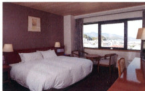
ダブルルーム Double Room (全6室/24㎡)