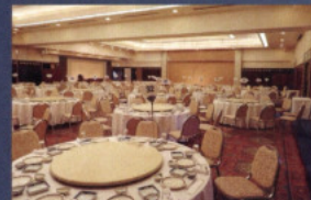
光彩全体(光彩+晴海)